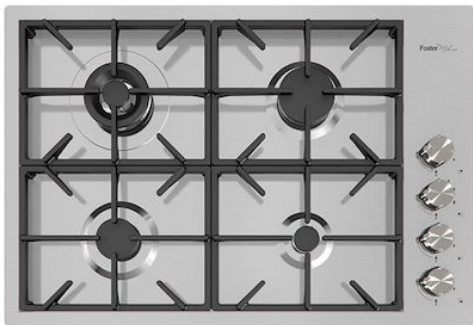
Table de cuisson Foster Milano